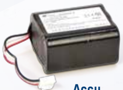
Accu Art.nr.: DLLOBOBAT