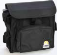
Soft Case Art.nr.: DLL-SOFTCASE

Wilt u weten of deze handige portable printer iets voor u is? Bestel nu het LOBO proefpakket en probeer 2 weken lang deze unieke labeloplossing voor industrie en kantoor!